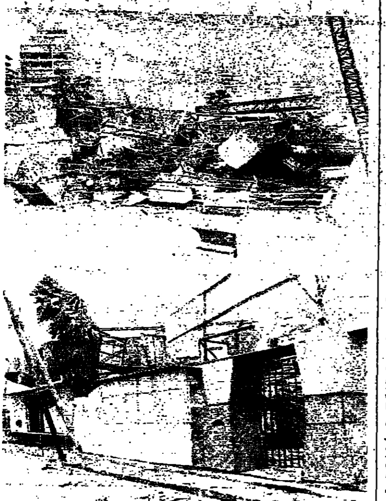
مدينة الختامي في النبطية وقد دمجت امس بقبول الرياح

حذرت دوائر الرصد الجوي في مطار بيروت القوي المواطنين من سلوك طريق شهبان البينين - صوفرين بسبب عاصفة تلبية هذه العاصفة - والاشارة الى ان مطح العرق الجبلية مطفوعة وان العاصفة مستمرة الى مساء اليوم.